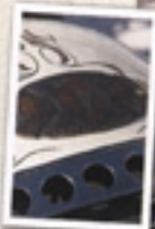
C'est de la customisation ayant été poussée à l'extrême, c'est à présent dans le détail que se marque la différence.

son huile dans un bac dessiné par Independent Cycles East et situé à l'avant du cadre, tandis qu'après digestion, il recrache la fumée par un unique échappement ayant reçu un traitement céramique anodisé de noir et coupant la moto sur presque toute la longueur. Le moteur entraîne une Torch Box 5 RDS Baker. La Rolls des boîtes de vitesses en quelque sorte. Sur cette machine, ce que je préfère, ce sont les jantes. Elles sont signées Ness et Independent Cycles East. Camière est freiné par un tambour Euro Comp, alors que le moyeu de la roue avant reçoit un frein 350" placé à droite et à peine visible. Une fois n'est pas coutume, ce custom est équipé de quasiment tout l'attirail nécessaire, et chaque pièce est homemade : support de plaque, feu arrière, rétroviseur, compteur de vitesse, il y a même des LED